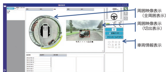
遠隔監視システムでの見せ方(画面例)