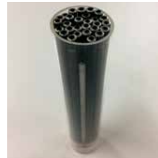
ハステロイ管型触媒写真