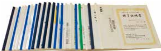
テキストと修了証明書