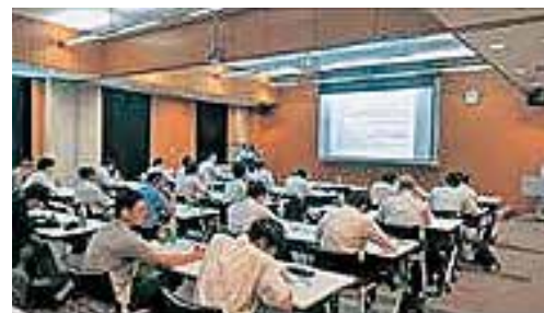
リスクアセスメント講座の風景