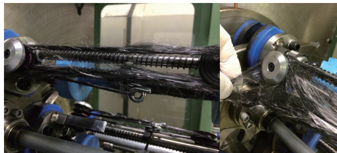
リサイクル糸は、痛みやすく、特に連続繊維をそのままテキスタイル加工することは困難であった。